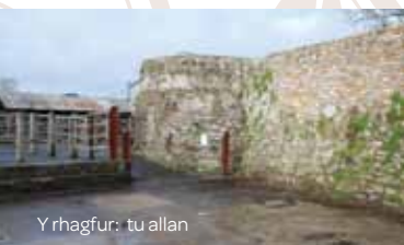
Y rhagfur: tu allan

Mae gwaith archeolegol dros y blynyddoedd diwethaf wedi datgelu cryn dipyn o hanes muriau'r Bontfaen. Canfuwyd craidd canoloesol gwreiddiol y rhagfur yng nghornel darluniol Gerddi'r Hen Neuadd yn gyfan o hyd, ac mae creneliad y bylchfur sy'n arwain ato'n dyddio o'r ddeunawfed ganrif, pan fu Thomas Edmondes yn ail-wneud y gerddi. Mae'n bosibl fod y muriau gwreiddiol yn grenellog, ond mae'n fwy tebygol mai dychymyg Rhamantaidd diweddarach oedd yn gyfrifol am greu'r fath nodweddion. Gan fod y bylchfur yn edrych dros The Butts, lle y dywedir i saethyddion Cymreig a fu yn Agincourt fod yn ymarfer eu sgiliau, mae'r elfen ffantasiol hon yn ddigon addas.