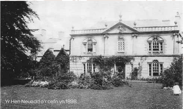
Yr Hen Neuadd o'r cefn yn 1898

Erbyn diwedd y bedwaredd ganrif ar bymtheg, roedd chwaeth cynlluniau gerddi wedi newid. Mae dyddiadur yr Hybarch Frederic William Edmondes (1840–1918) yn y 1860au a'r 1870au yn cyfeirio at blanhigion tresi aur, coed planwydd a gemau tenis – adloniant ffasiynol i fenywod (roedd y cyrtiau ar safle'r llyfrgell nawr) – a lawnt croce o flaen y tŷ cyn i'r ardd isel, sef y pwll bellach, gael ei sefydlu.