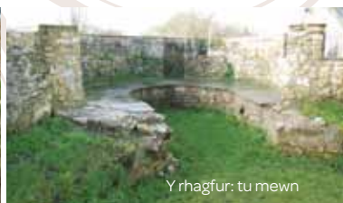
Y rhagfur: tu mewn