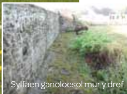
Sylfaen ganoloesol mur y dref

Adferwyd muriau'r dref gan Ymddiriedolaeth Siarter Y Bontfaen yn 2011, gan ddefnyddio deunyddiau adeiladu gwreiddiol pan oedd hynny'n bosibl, ac maen nhw bellach wedi eu cofrestru.