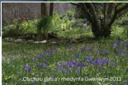
Clychau glas a'r rhedynfa Gwanwyn 2013

cerdded ar hyd prif lwybr yr Ardd Berlysiau i gyrraedd Eglwys y Groes Sanctaidd ac eistedd yng nghôr y teulu, a'i gŵr yn ficer y plwyf.