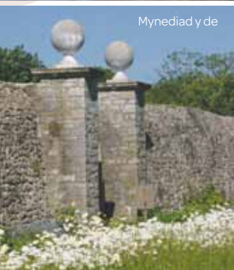
Mynediad y de

Ailadeiladwyd y mur deheuol yn gymharol dila, i hanner ei drwch canoloesol, ac ychwanegwyd dwy fynedfa ato, â phileri Clasurrol eu dull a pheli ar eu pen uchaf. Gellir gweld y trwch canoloesol gwreiddiol yn y cornel de-ddwyreiniol o hyd (ger yr Ardd Berlyisiau), ers pan y datgloddiwyd y mur yn ystod y tirlfesuriad archeolegol cyn cychwyn prosiect adfer Ymddiriedolaeth Siarter Y Bontfaen. Plannwyd teim ymgripiol yn yr ardal hon er mwyn sadio'r gwaith cerrig rhydd a chreu carped deniadol a phersawrus.