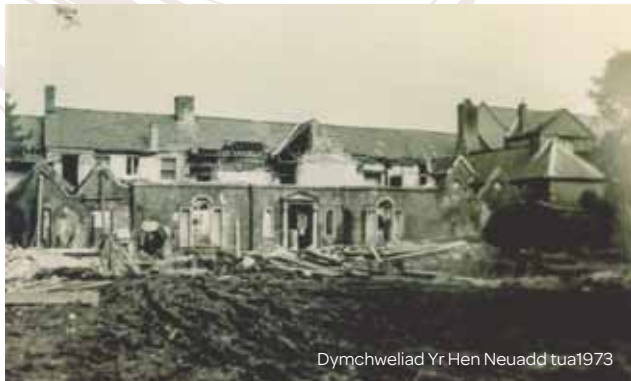
Dymchweliad Yr Hen Neuadd tua 1973

Bu'r teulu Edmondes yn byw yn yr Hen Neuadd tan 1932, pan drosglwyddwyd hi i Ysgol Ramadeg Y Bontfaen a'i defnyddio ar gyfer ystafelloedd dosbarth, llyfrgell ac ystafell athrawon. Ychydig iawn o incwm oedd ar gael i gynnal a chadw'r adeilad, a dirywiodd yn raddol nes y dyfarnwyd ei fod yn beryglus yn y 1960au cynnar.