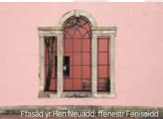
Ffasâd yr Hen Neuadd: ffenestr Fenisaid