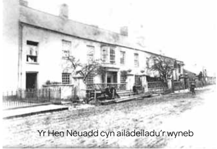
Yr Hen Neuadd cyn ailadeiladu'r wyneb

Ar ôl marwolaeth Thomas Edmondess yn 1893, cyfunwyd y ddau adeilad. Ailadeiladwyd y tu blaen a wynebai'r stryd mewn arddull ffug-Duduraidd â phorth carreg, ac ychwanegwyd sawl ystafell hefyd.