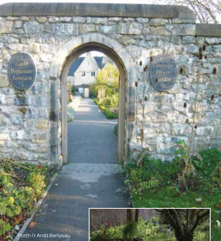
Porth i'r Ardd Berlysiau