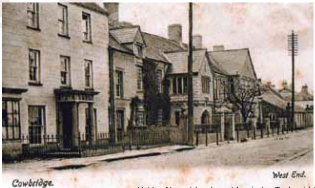
Yr Hen Neuadd gydag addurniadau Tuduraidd