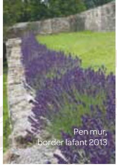
Pen mur, border lafant 2013