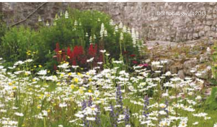
Dôl flodau gwyllt 2013

Mae dau nod gan Ymddiriedolaeth Siarter Y Bontfaen: adfer gerddi'r Hen Neuadd er mwyn adfywio'u harddwch coll, ac ail-greu'r cynefin a gollwyd pan atgyweiriwyd y muriau, trwy blannu planhigion cymharus â bywyd gwyllt (rhai brodorol gan mwyaf. Am fanylion pellach, gweler y daflen ar fioamrywiaeth). Mae'n fwriad gan yr Ymddiriedolaeth hefyd gynnal y muriau a'r adeiladwaith er mwyn i'r nodweddion hanesyddol gwerthfawr yma gael eu cadw er mwyn i'r cenedlaethau a ddaw gael eu swyno ganddynt.