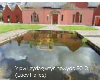
Y pwll gydag ynys newydd 2013 (Lucy Hailes)

Mae lluniau a dynnwyd yn y bedwaredd ganrif ar bymtheg hwyr yn dangos gwelyau blodau perffaiht, cloddiau wedi eu tocio a rhosod yn tyfu yn erbyn muriau'r tŷ. Roedd y fan lle mae'r Ardd Berlysiu nawr yn rhan o erddi'r Hen Neuadd hefyd. Fwy na thebyg mai gardd gegin oedd hi, a borderi